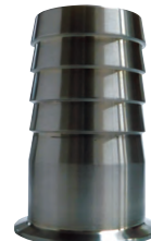
醸造用サニタリータケノコ2インチ 2S×φ52.5