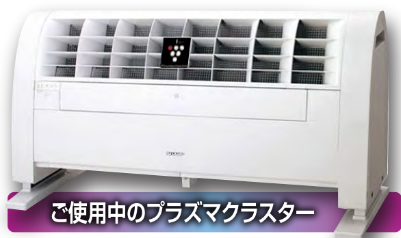
ご使用中のプラズマクラスター

廻室や圧搾室でご使用中の プラズマクラスター内部を 見たことありますか？ 汚れた状態で 夏を越しますか？