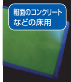
粗面のコンクリートなどの床用