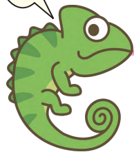
粘着ウレタンゲル