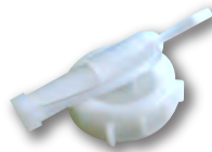
スクイジーボトル、 注ぎやすい コックは別売