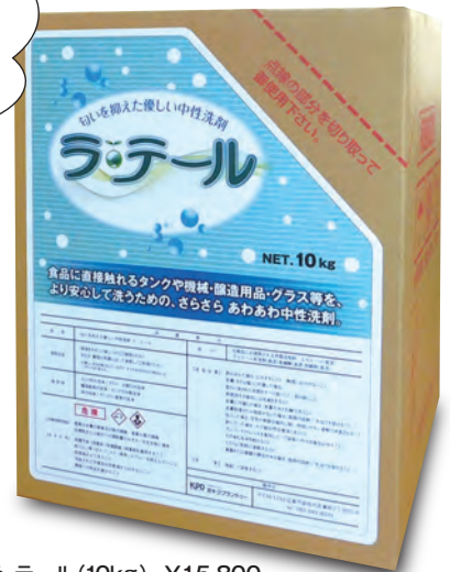
ラ・テール (10kg) ¥15,800 ※ 別途荷造り送料がかかります。