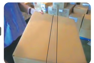
上下同時にテーピング完成