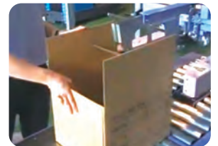
ワークメイトで箱詰