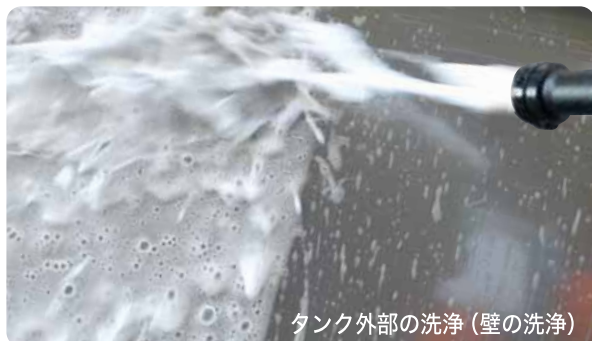
タンク外部の洗浄 (壁の洗浄)

容器に洗剤原液を入れ、水道と直結するだけで、簡単に発泡洗浄が可能です。付属のチップと交換するだけで自在の希釈倍率に変更可能です。また、ノズルを交換し、扇形のすすぎ洗浄もできます。