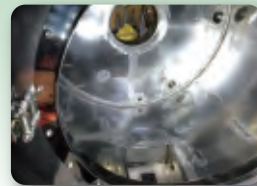
酸洗い・酸化皮膜処理