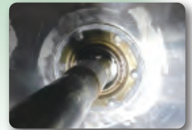
軸受部の防錆対策コーキング

ラ・クリーンは、メーカーとタッグを組み 食品に触れる布のために改良設計した これまでにないドラム式洗濯機です。