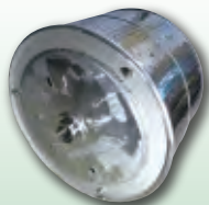
ドラムのバリ処理・研磨処理