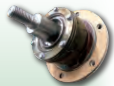
軸受部の防錆塗膜処理