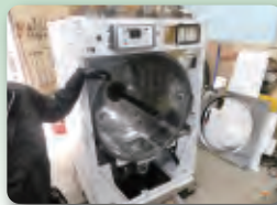
当社工場での分解・洗浄

通常メーカーでは行わない 酸洗い・酸化皮膜処理・ 軸受部の防錆処理など、 槽内接水部の処理を 更にこだわりました。