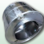
ドラムの酸化皮膜処理