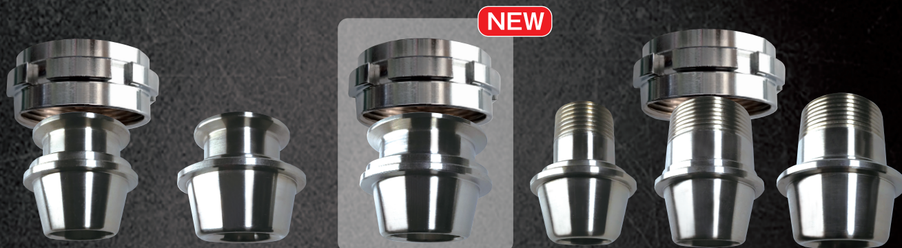
2号・3号呑用×2Sもできました!

SUS316製で、日本酒・リキュール・醤油・酢など様々な液種に対応できます。ヘルール式は1.5Sや2Sに変換し、ネジ式は25A・40Aに変換した優れたものアイテムです。